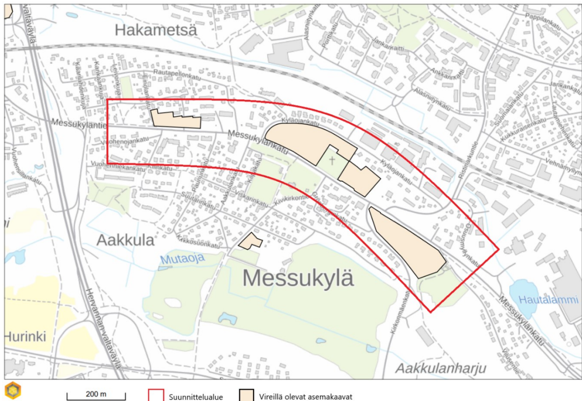
Kuva 1 Suunnittelualue

Tampereen kaupungin toimeksiannosta Ramboll Finland Oy on laatinut tämän lausunnon koskien Messukyläntien yleissuunnitelma-alueen asemakaavasuunnittelua. Lausunto koskee kuvassa 1 esitettyjä vireillä olevia ja tulevia kaavamuutoshankkeita ja lausunnossa otetaan kantaa rakentamisen ja pilaantuneiden maiden puhdistamisen vaikutuksiin alueen pohjaveteen.